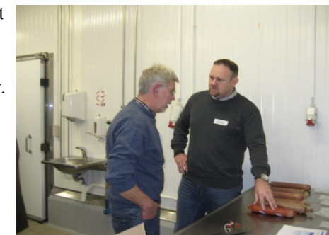
Der var stor interesse for at få en snak om de forskellige tarmes egenskaber.

Halkjærvej 14 DK-9200 Aalborg SV Tel.: +45 70238060 Fax.: +45 70238040