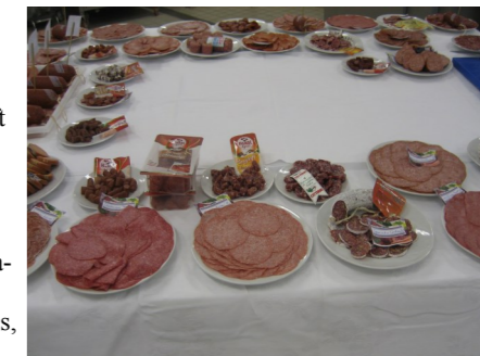
De mange specialiteter, der var mulighed for at smage efter selve seminaret.