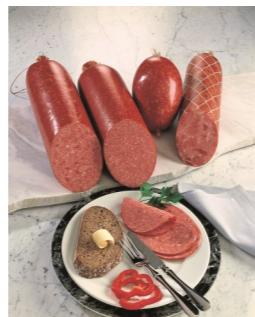
Nogle få kontrolpunkter, sikre gode ensartede pølser

Spegepølser er bakteriologisk stabile uden køl når pH er <5,2 og a w <0,89